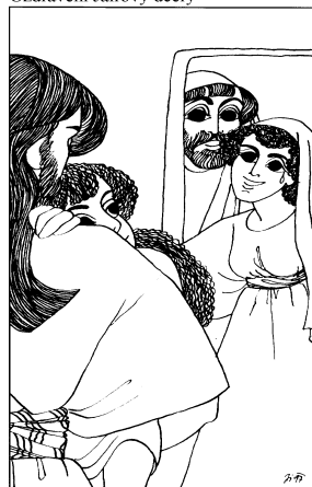
Uzdravení Jairovy dcery

Keď potom Ježiš prišiel do domu popredného muža a videl pískajúcich na píšťalách a rozrušený dav, povedal: „Odíďte! Dievča neumrelo, ale spí.“ Oni ho vysmiali. Ale keď dav rozohnali, vošiel dnu, chytil dievča za ruku a ono vstalo. A chýr o tom sa rozniesol po celej krajine. Mt 9, 18-26